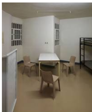
Andreas Magdanz, Ansicht der Zelle 719, 2010/2011, © Andreas Magdanz, Buch- & Ausstellungsprojekt Stammheim, Printversion Katje Cantz, Ebook MagBooks

Bilderna är strikta, nästan tråkiga i sin torrhet och vilja att visa en detaljerad bild av ett