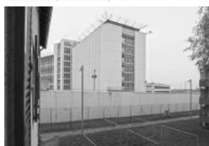
Andreas Magdanz, Blick auf den Hof aus Wohnung in der 7. Etage des Blocks, 2010/2011, © Andreas Magdanz, Buch- & Ausstellungsprojekt Stammheim, Printversion Katje Cantz, Ebook MagBooks