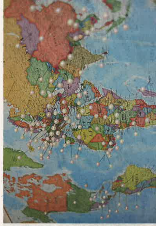
Louise Moloneys sätter en nål på kartan för varje par som kommer till ön för att gifta sig.