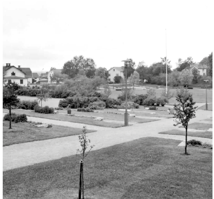
Samarbetet med HSB bidrog till att forma de nya funktionalistiska bostadsområden som växte fram i Vimmerby, Uppsala, Nynäshamn, Eskilstuna och på Reimersholme i Stockholm.

– Jag tycker det är lite synd att hon delvis skymms av mytologiseringen där hon framställs som excentrisk och extravagant i stället för att se på det hon faktiskt lämnar efter sig i form av bostadsområden, parker, kursgårdar också vidare. Det är anläggningar som förenar landskapsarkitektur och trädgårdsarkitektur på ett jättestort sätt, säger Jonas Berglund från Nivå.