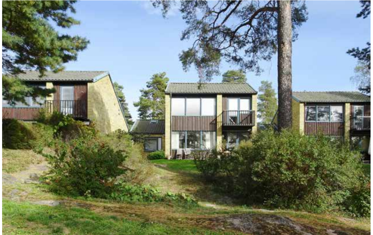
Radhusen vid Mälarblick i Bromma är från tidigt 1960-tal.

”Det är lite synd att hon delvis skymms av mytologiseringen där hon framställs som excentrisk och extravagant i stället för att se på det hon faktiskt lämnar efter sig.”