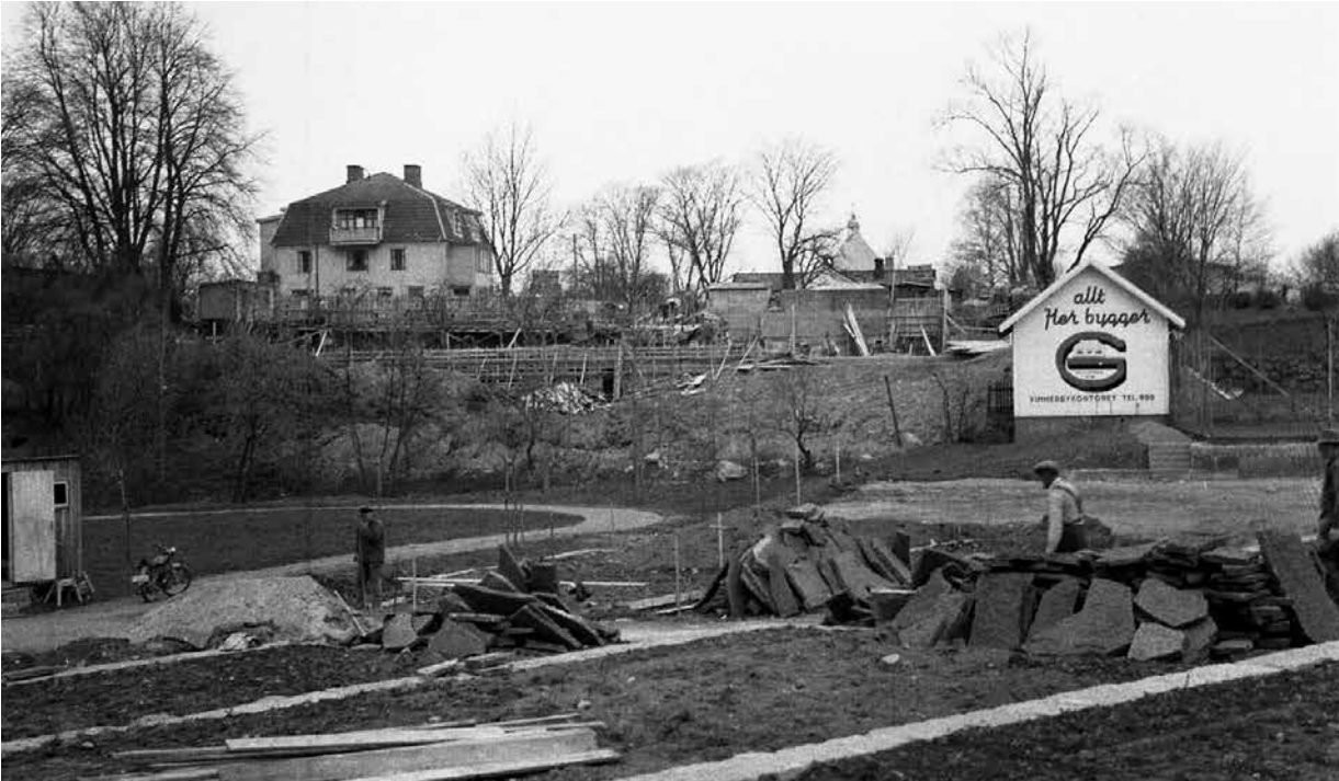
Terrasserna i Källängsparken i Vimmerby anlades på 1950-talet.

”Yrket landskapsarkitekt fanns inte ens i Sverige när hon föddes 1913.”