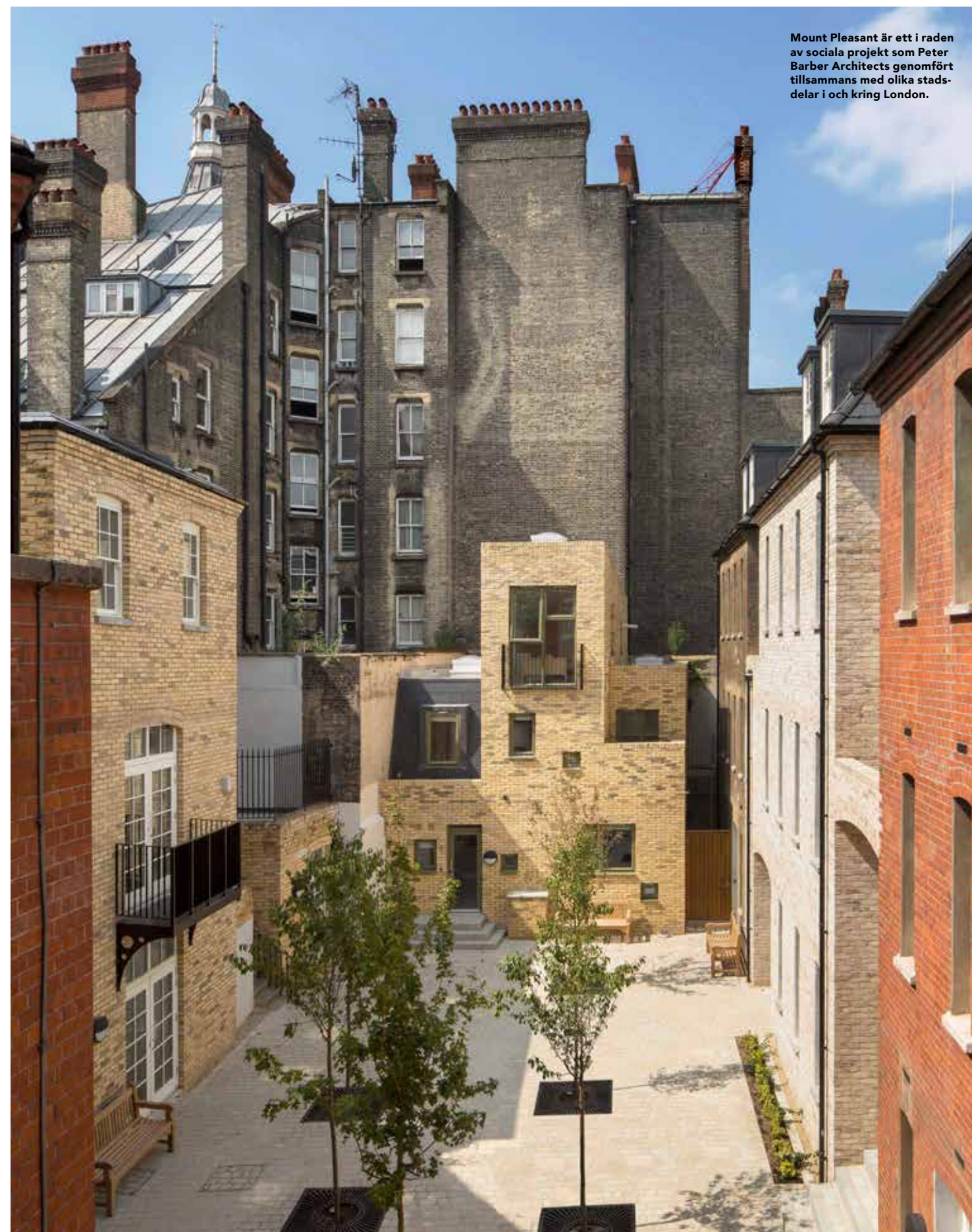
Mount Pleasant är ett i raden av sociala projekt som Peter Barber Architects genomfört tillsammans med olika stadsdelar i och kring London.

Mount Pleasant ligger lite gömt på en trång gata i Camden med samma namn. På svenska blir det "Trevliga berget", vilket är något missvisande. Några berg finns det knappast i London och särskilt trevligt var Mount Pleasant heller inte efter otaliga om- och tillbyggnationer. ▶